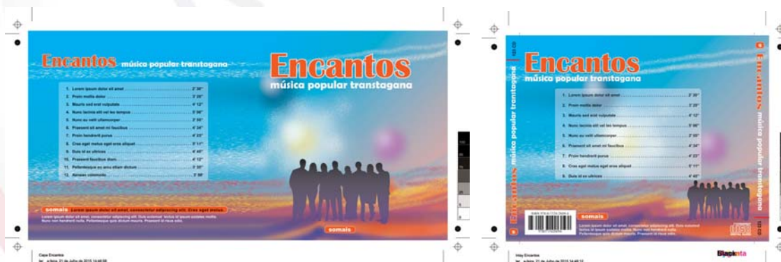
Livro de 4 páginas